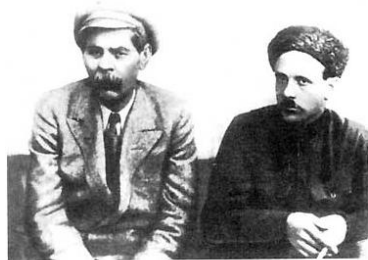
А.М. Горький и М.С. Погребинский

Далее идет условная страница ревизионного журнала: